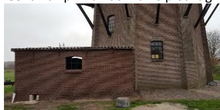
Motoruitbouw bij Molen De Star

Helaas laten de coronaregels al ruim een jaar geen activiteiten toe bij Molen De Star. Momenteel is er nog weinig bekend. Totdat de regels worden versoepeld zal ook helaas de molen gesloten blijven voor bezoek. We vallen onder de regels van een museum, plus dat de molen niet geschikt is voor eenrichtingsverkeer. De Molenwinkel blijft uiteraard elke zaterdag van 10.00-16.00 open. Hopelijk gaat de Overijsselse Molendag en Open Monumentendag door op de tweede zaterdag in september. Als het meezit draait dan de Rustonmotor. Deze dag moet uiteraard een feestelijk tintje krijgen. Het ziet er naar uit dat er op 14 mei een huwelijk zal plaatsvinden bij de Molen. Twee inwoners van Balkbrug, woonachtig vlak bij de Molen, geven dan elkaar het ja-woord. Dit moet allemaal Corona-proef gebeuren. Bovendien moet het terrein rond de Molen netjes gemaakt worden. En dan moet de gemeente nog toestemming geven. Dus alles is nog onder voorbehoud. Maar de Molen leent zich prima voor zulke plechtigheden.