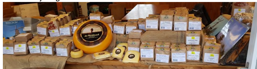
Overzicht meel- en kaasproducten