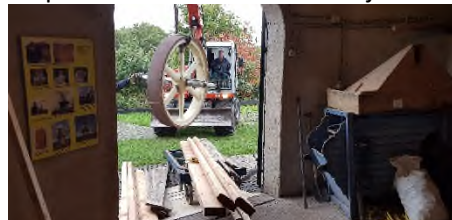
Overplaatsing krukas + vliegwiel.