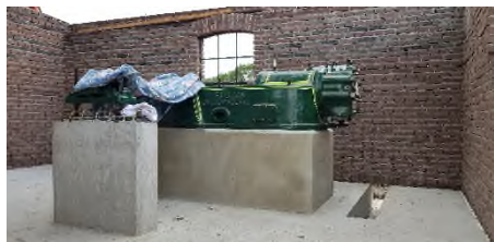
Ruston motor op zijn definitieve plek op het betonblok