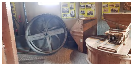
Poelie + koppel maalstenen voor maalstoel