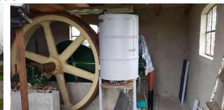
Blik in motoruitbouw