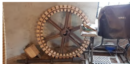
2e kamwiel onderaandrijving maalstoel