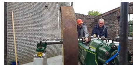
Na plaatsing worden de eerste drupjes olie in de lagers gedaan.