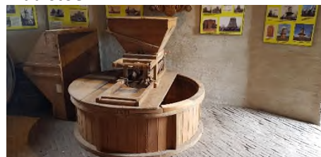
Steenkuip (omhulsel van de stenen)