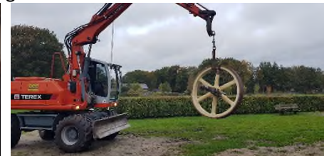
Overplaatsing krukas + vliegwiel.