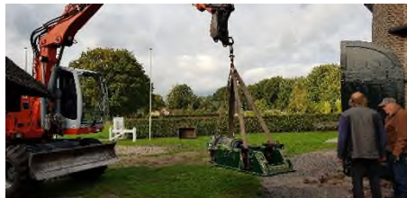
Ruston motor in de takels