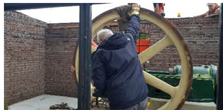
Plaatsing krukas + vliegwiel op motor