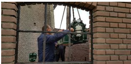
Plaatsen Ruston motor in motoruitbouw