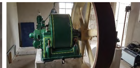
Blik in motoruitbouw