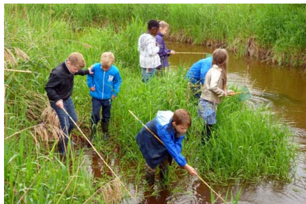
Green kids in actie