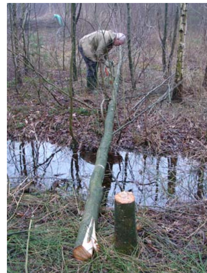
Landschapbeheer in Plan Hof